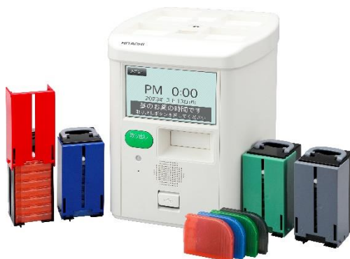
新型「服薬支援ロボ」

日立チャネルソリューションズ株式会社(以下、日立チャネルソリューションズ)は、現在約 6,000 台が稼働する服薬支援装置「服薬支援ロボ」を、多くの利用者の声を活かし新たに開発し、操作性と利便性向上などより使いやすく進化させました。患者さまの正しい服薬と薬剤師による服薬管理のサポートをさらに強化する新型「服薬支援ロボ」を5月15日から販売開始します。本製品は、Wi-Fi機能の搭載が可能で、今後提供を計画しているリモート服薬支援サービスなどネットワークを活用したサービスの利用につながります。